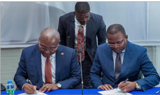
Assinatura de protocolo entre INAPEM, Conselho Superior da Magistratura Judiciária, IPS e IAPMEI | 9Nov22