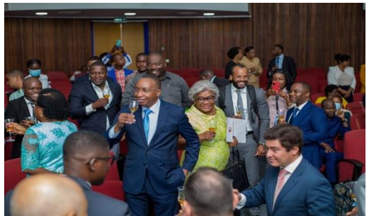
Cerimónia de abertura da formação no INEJ | 9Nov22