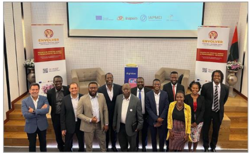
Evento de apresentação da evolução dos trabalhos realizados para a implementação da futura Rede Nacional de Incubadoras em Angola | 8nov22