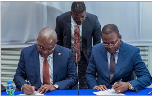
Assinatura de protocolo entre INAPEM, Conselho Superior da Magistratura Judiciária, IPS e IAPMEI | 9Nov22