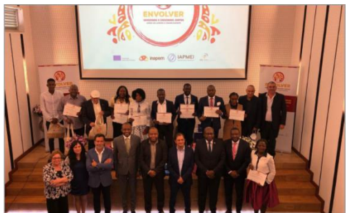
Cerimónia de entrega de certificados aos colaboradores do INAPEM e parceiros estratégicos | 30Maio22