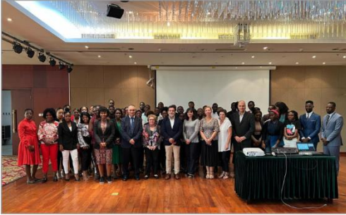
Apresentação das ferramentas desenvolvidas no âmbito do Projecto Envolver aos técnicos do INAPEM e públicos estratégicos | 18Nov22