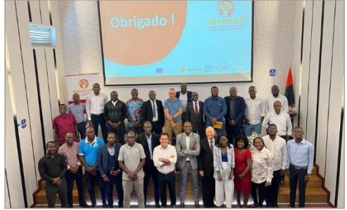
Sessão de abertura das ações de formação para os candidatos ao ingresso na Bolsa de Formadores | 9nov22