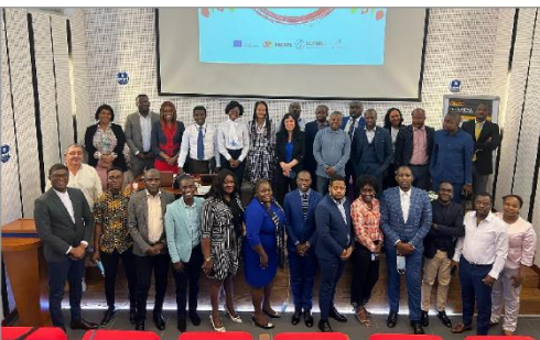
Conclusão da 1ª edição das ações de formação e capacitação junto das Instituições Bancárias. | 09jul2022